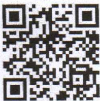
แบบขอโอน