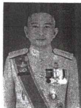
๑๐. พลโท วุฒิไชย อิศระ เจ้ากรมแพทย์ทหารบก