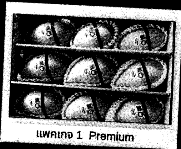
แพ็คเกจ 1 Premium

บรรจุ 9-12 ผล กล่องสีแดงสุดพรุ ห่อโฟมรััดร์บับน นน.รวม 5 กก.