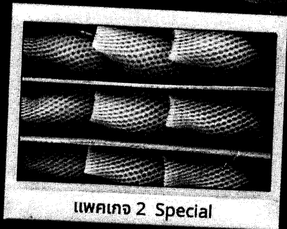
แพ็คเกจ 2 Special

บรรจุกล่องสีน้ำตาลรักษ์โลก 9-12 ผล ห่อโฟมกันกระแทก นน.รวม 5 กก.