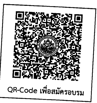
QR-Code เพื่อสมัครอบรม

หมายเหตุ กรณีผู้สมัครเข้ารับการฝึกอบรมดำเนินการชำระเงินค่าลงทะเบียนล่วงหน้า แต่ไม่สามารถมาเข้ารับการฝึกอบรมได้ กรุณาแจ้งมหาวิทยาลัยล่วงหน้าอย่างน้อย ๕ วัน หากไม่มีการแจ้งล่วงหน้าจะถือว่าท่านมีความประสงค์เข้ารับการฝึกอบรม ตามปกติ